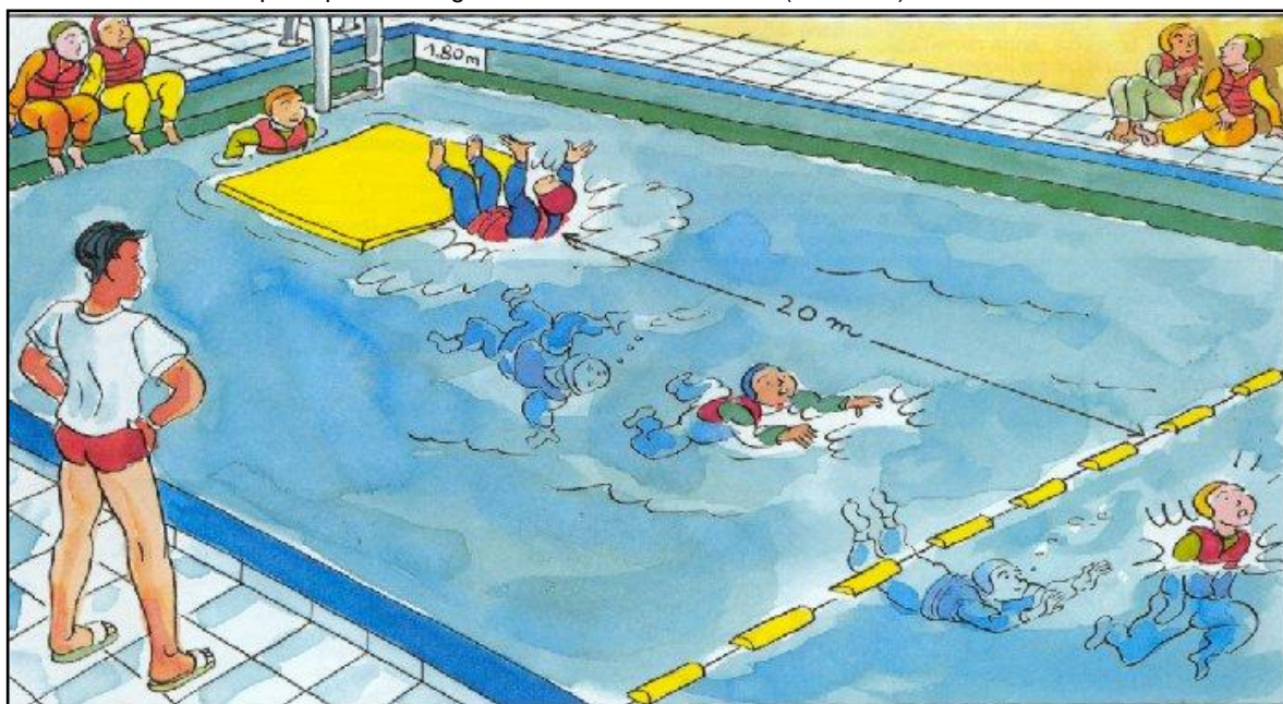
Illustration du test de natation nécessaire avant la pratique des sports nautiques (B.O. n°22 du 8 juin 2000)

* Le titre de maître nageur sauveteur est conféré par la possession d'un diplôme d'État de maître-nageur sauveteur ou du brevet d'État d'éducateur sportif premier degré des activités de natation (BEESAN).